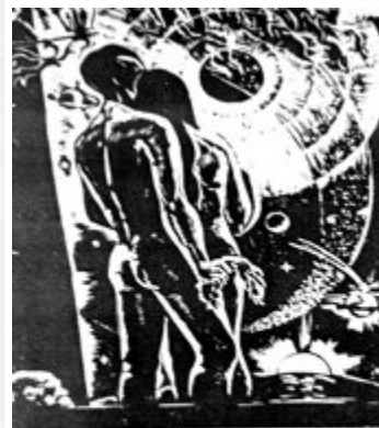
Ján Smrek Obraz sveta

Je autorom básnických zbierok Odsúdený k večitej žízni (1922), Cválajúce dni (1925), Božské uzly (1929), Iba oči (1933), Básnik a žena (1934), Zrno (1935), Hostina (1944), Studňa (1945), Obraz sveta (1958), Struny (1962). Písané na sude (1964), Nerušte moje kruhy (1965), Výbery: Knihy mladosti 1 – 2 (1948), vybrané verše (1954), Ženy (1971), Moje najmilšie (1972), Ružový spev mi prší z úst (1973) Podoby lásky (1978), Krásna prostota (1979), Bacardi a iné básne (1979).