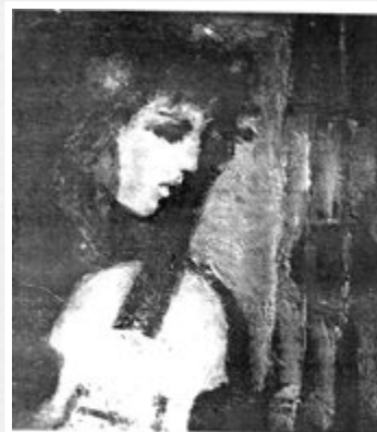
Ján Smrek Struny

Ján Smrek spolupracoval so slovenským hudobným skladateľom Jánom Cikkerom na librete opery Beg Bajazid a je aj spolutvorcom libreta opery Mr. Scrooge (Tiene). Medzi spolupracovníkmi – hudobnými skladateľmi je Frico Kafenda, ktorý skomponoval na slová básnika cyklus troch piesní: Listy, Okúzlenie a Pieseň. K Smrekovej poézii si našiel cestu aj Eugen Suchoň. Okrem iných skladieb skomponoval na slová Jána Smreka k 50. výročiu Spevákkeho zboru slovenských učiteľov skladbu Slovenská pieseň pre mužský zbor. Poézia Jána Smreka poslúžila aj Andrejovi Očenášovi, Otovi Ferenczymu a Alfrédovi Zemanovskému.